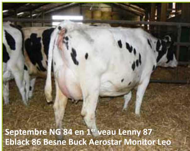
Septembre NG 84 en 1 er veau Lenny 87 Eblack 86 Besne Buck Aerostar Monitor Leo