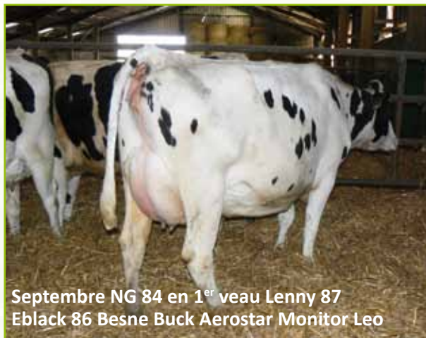
Septembre NG 84 en 1 er veau Lenny 87 Eblack 86 Besne Buck Aerostar Monitor Leo