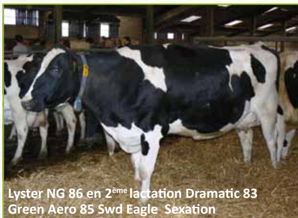
Lyster NG 86 en 2 ème lactation Dramatic 83 Green Aero 85 Swd Eagle Sexation