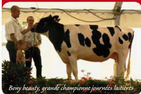
Bony beauty, grande championne journées laitières